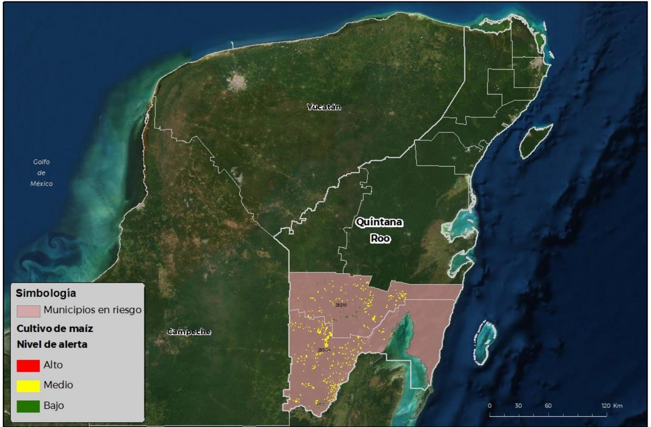
Municipios con cultivo y probable riesgo por Gusano cogollero en Quintana Roo

CEOMATICA-03-SENASICA © 2021 RCO FECHA: 11-OCTUBRE-2021